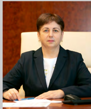
Tamara Gheorghita a fost numită în funcția de Secretar general al Parlamentului din 9 septembrie 2021.